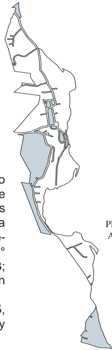
Planta urbana Actualización 2001